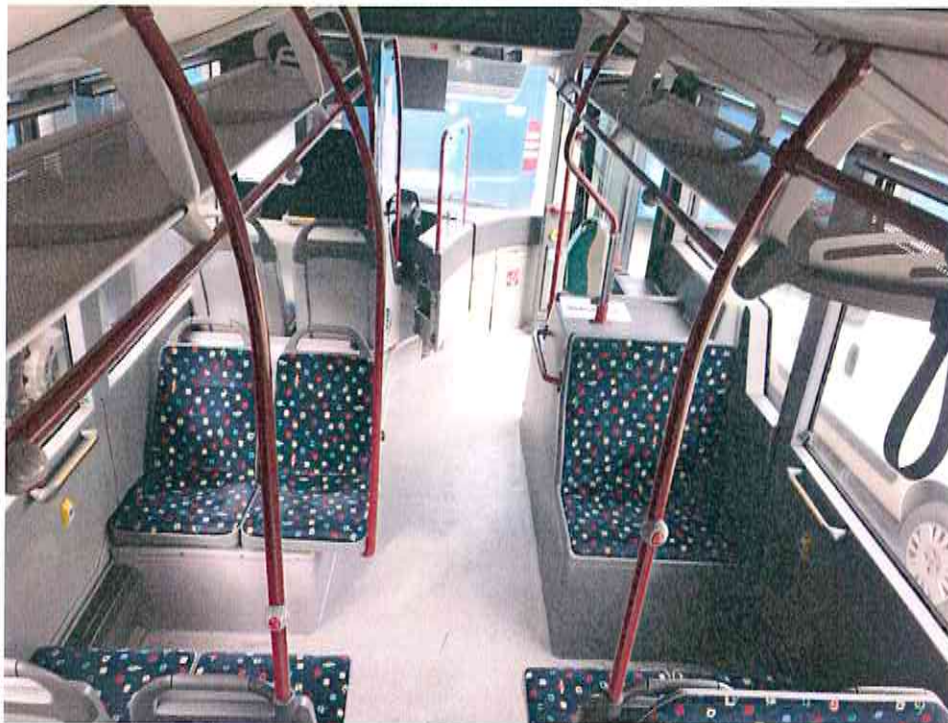
Inquadratura telecamera 3