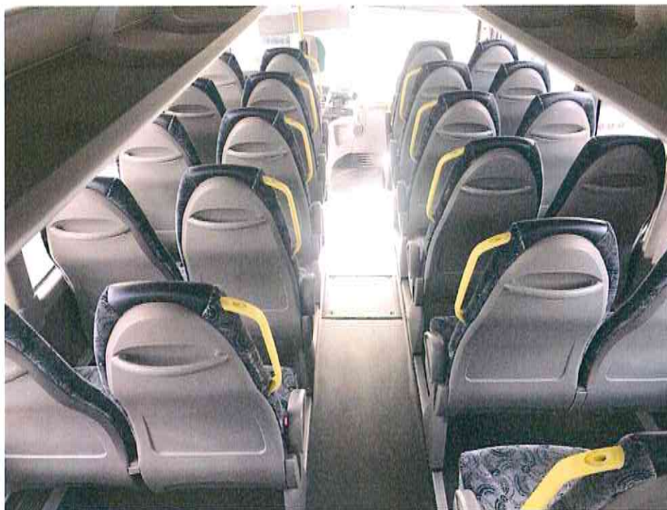
Inquadratura telecamera 3