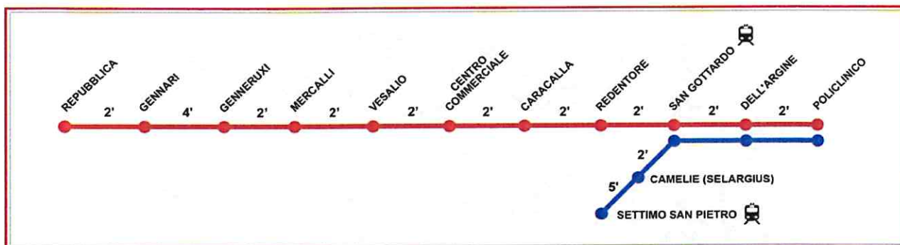
Fig. 5 – Schema di percorso, direzione Policlinico.