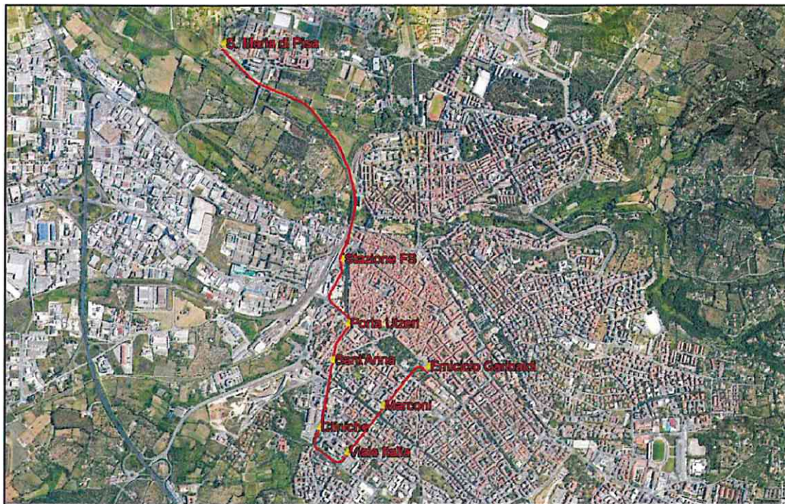
Fig. 2 - Metrotranvia di Sassari