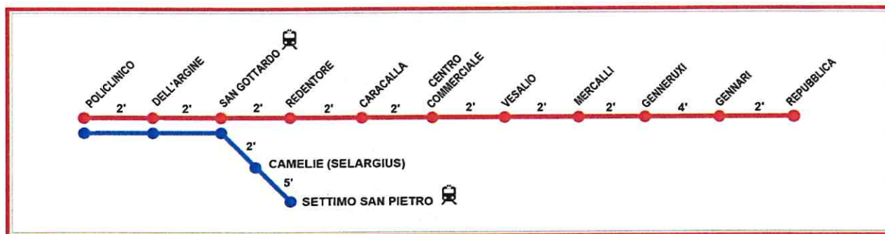
Fig. 6 – Schema di percorso, direzione Repubblica.

Si riporta di seguito la tabella con l'indicazione delle fermate e la quantità dei cartelli previsti per ognuna.