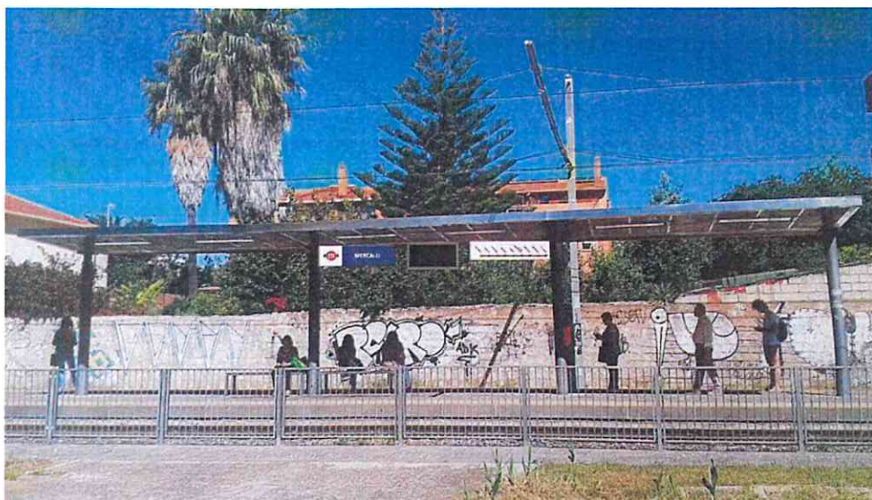
Fig. 3 – Esempio indicativo di disposizione dei cartelli in fermata